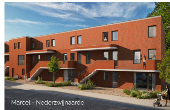
Marcel - Nederzwijnaarde

Meerlenhof is een realisatie van Koramic Real Estate, het toonaangevende vastgoedbedrijf dat onderdeel uitmaakt van de Koramic Groep. Dat de Koramic Groep een vlag is die vele ladingen dekt, is een understatement. De Koramic Groep, die opgericht werd in Kortrijk in 1883, zag het licht als bouwmaterialenproducent en heeft zich door de jaren heen ontwikkeld als investeringsmaatschappij en een brede range aan, veelal industriële, activiteiten. Naast de divisies "Koramic2Engage", "Koramic Construction Chemicals" en "Koramic Ceramics" is Koramic ook onder meer actief in visual communication, productie en verkoop van