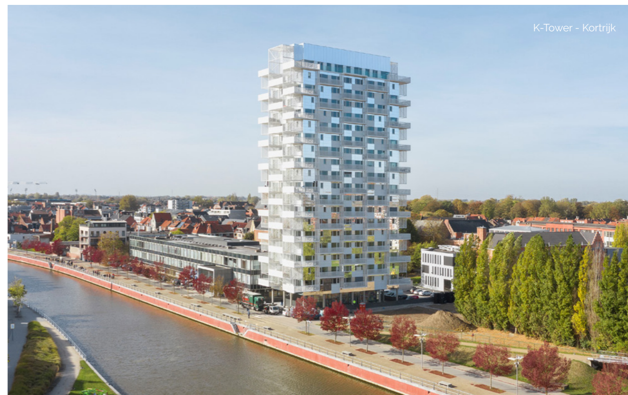
K-Tower - Kortrijk