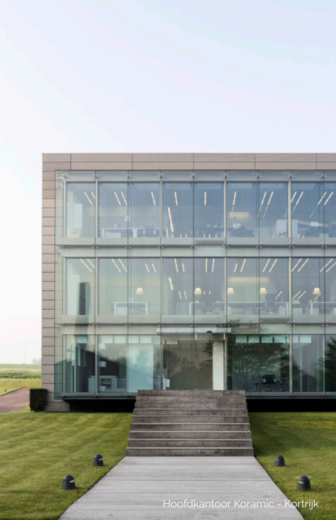
Hoofdkantoor Koramic - Kortrijk