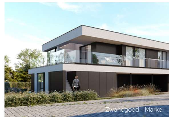
Zwanegoed - Marke

zinkproducten, productie van plastics, aluminium en koper geleiders, ... Koramic Real Estate investeert in het beheer en de verhuur van commercieel vastgoed (kantoorgebouwen en industrieel vastgoed), maar ontwikkelt ook zelf residentiële en commerciële vastgoedprojecten in binnen- én buitenland (Duitsland, Polen en Roemenië). Daarbij vormt een uitgesproken passie voor esthetiek en kwaliteit de leidraad. De Koramic-vennootschappen realiseren een omzet van ca 600 mio euro en stellen samen meer dan 6.000 mensen tewerk. Onnodig te stellen dus dat uw investering bij ons in goede handen is!