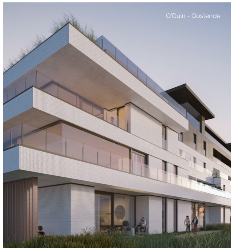
O'Duin - Oostende