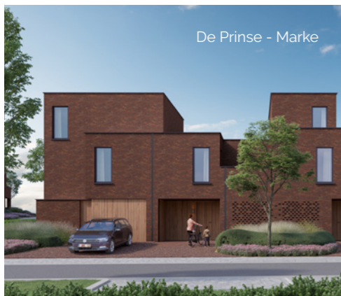
De Prinse - Marke